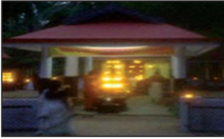
മുല്ലശ്ശേരി പണിയിക്കശ്ശേരി ക്ഷേത്രം