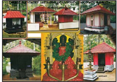
വള്ളംപറമ്പത്ത് പണിയിക്കശ്ശേരി ക്ഷേത്രം

കുടുംബങ്ങളും, മുസ്ലീം കുടുംബങ്ങളും പണിയിക്കശ്ശേരി എന്ന പേരിൽ അറിയപ്പെടുന്നുണ്ട്. അതിന്റെ കുടുതൽ വിവരങ്ങൾ അറിയാൻ പഠിക്കേണ്ടിയിരിക്കുന്നു. ഈ എല്ലാ പണിയിക്കശ്ശേരിക്കാരെയും പങ്കെടുപ്പിച്ചു കൊണ്ട് വിശദമായ ഒരു പഠനം നടത്തേണ്ട കാലം അതിക്രമിച്ചിരിക്കുന്നു. കാലക്രമേണ ഈ സംരംഭം നടക്കുമെന്ന് പ്രതീക്ഷിക്കാം.