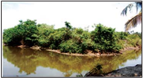
ഡച്ച് കോട്ട- ചേറ്റുവ