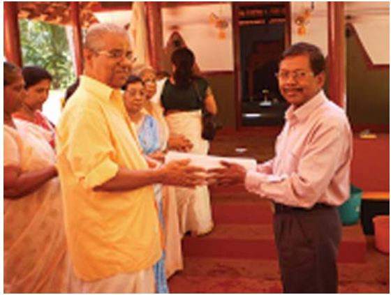
തറവാട്ടംഗങ്ങളുടെ വിശദവിവരങ്ങൾ അടങ്ങിയ ഫോറം ഉദ്ഘാടനം

കുടുംബ ചരിത്രത്തിലും web site - ലും ഓരോ ഫാമിലി മെമ്പേഴ്സിന്റേയും കുടുംബ നാമന്റേയും (Head of the family) കുടുംബനാഥയുടേയും ഫോട്ടോകളും അവരുടെ വീടിനെപ്പറ്റിയുള്ള വിശദമായ വിവരങ്ങളും ചേർക്കാൻ ശ്രമിച്ചിട്ടുണ്ട്. ഒരു ഫാമിലി മെമ്പർ എന്ന് ഉദ്ദേശിക്കുന്നത് ആ വീട്ടിലെ ഏറ്റവും പ്രായം കൂടിയ ആൾ (Head of the family) അത് അച്ഛനാകാം അല്ലെങ്കിൽ അമ്മയാകാം. മക്കൾ കൂടെ താമസിക്കുന്നുവെങ്കിൽ അവരടക്കമാണ് ഒരു ഫാമിലി എന്ന് ആശയം. (മെമ്പേഴ്സിന്റെ കളർ ഫോട്ടോ Website - ൽ കാണുക) www.sarkkarapanikkassery@gmail.com