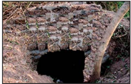
ഡച്ച് കോട്ട ഗുഹയുടെ പ്രവേശനകവാടം