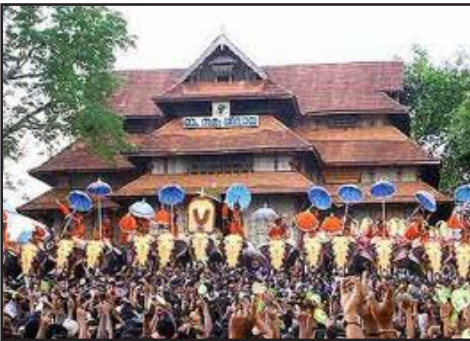
തൃശ്ശൂർ വടക്കുംനാഥ ക്ഷേത്രം

തറവാടിന്റെ പ്രധാന അമ്പലമായ കളരിക്ഷേത്രം കൂടാതെ അതിന്റെ വടക്കു വശത്തായി ദേവിയുടെ അമ്പലവും കുറച്ച് വടക്ക് പടിഞ്ഞാറ് ഭാഗത്തായി മുത്തപ്പന്റേയും പറക്കുട്ടിയുടേയും അമ്പലവും സ്ഥിതി ചെയ്യുന്നു. ചെറുപ്പം മുതൽ മുത്തപ്പന്റേയും പറക്കുട്ടിയുടേയും വീരസാഹസിക കഥകൾ കേട്ടുകൊണ്ടാണ് ഞാൻ വളർന്നത്. താന്ത്രിക മാന്ത്രികവിദ്യകളിൽ