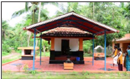
പണിയ്ക്കശ്ശേരി ദേവി ക്ഷേത്രം