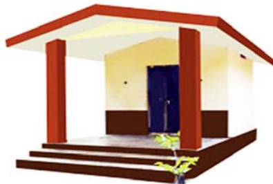
പണിയ്ക്കശ്ശേരി മുത്തപ്പൻ ക്ഷേത്രം